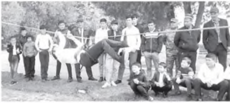
Qamashi tumanida umumta'lim va o'rta maxsus ta'lim maktablari o'rtasida "Yosh qutqaruvchi" musobaqasining tuman bosqichi bo'lib o'tdi.