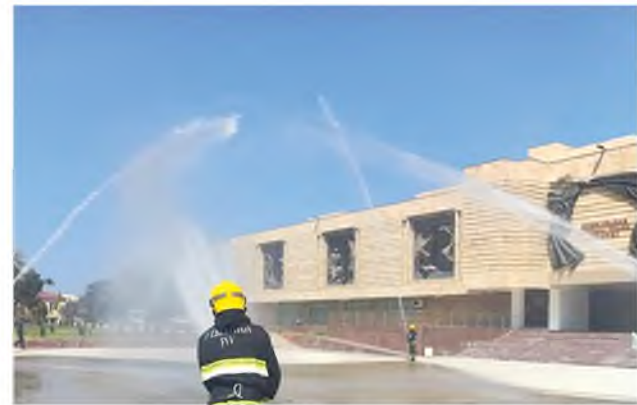
Farg'ona viloyati FVB axborot xizmati.

Farg'ona viloyatida mustaqillik bayrami tadbirlarini o'tkazish davrida xavfsizlikni ta'minlash va favqulodda vaziyatlarning oldini olish, sodir bo'lganda oqibatlarini qisqa fursatlarda bartaraf etish yuzasidan FVDTga kiruvchi xizmatlar bilan hamkorlikda profilaktik tadbirlar va maxsus-taktik o'quv mashg'ulotlari o'tkazilmoqda.